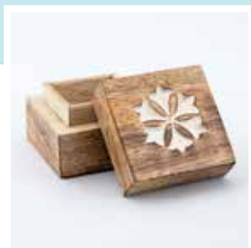
Petites boîtes en bois