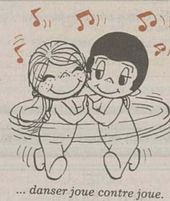
... danser joue contre joue.