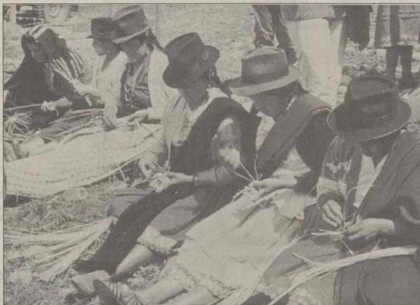
Swissaid a commandé 400 000 corbillons dans les montagnes équatoriennes. Au cours de l'année dernière, des femmes et des fillettes ont travaillé ensemble à l'exécution de cette importante commande.

C'est de l'Equateur que proviennent les petits corbillons vendus par des écoliers dans toute la Suisse au béné-