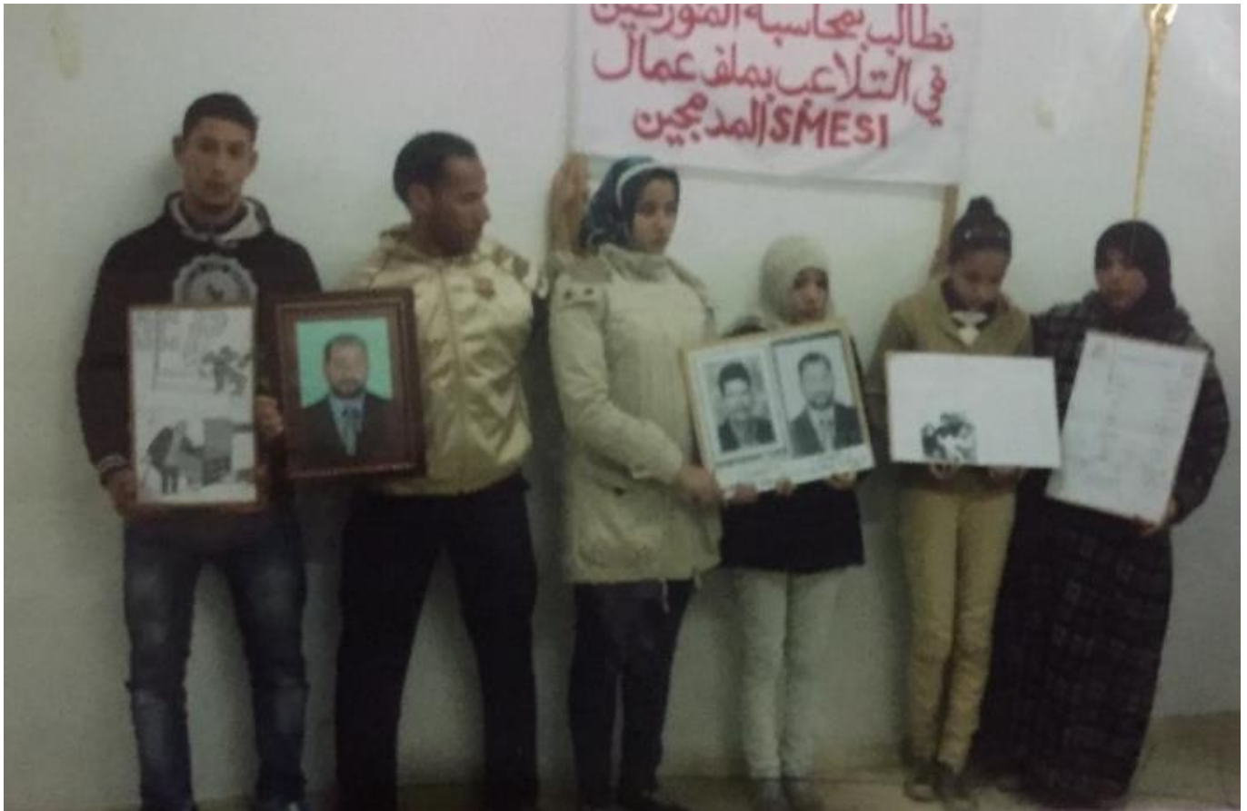
Protestation d'orphelins et de veuves d'agents OCP décédés.