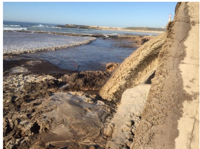
Déversement d'une eau acide et contaminée par l'uranium (février 2019).