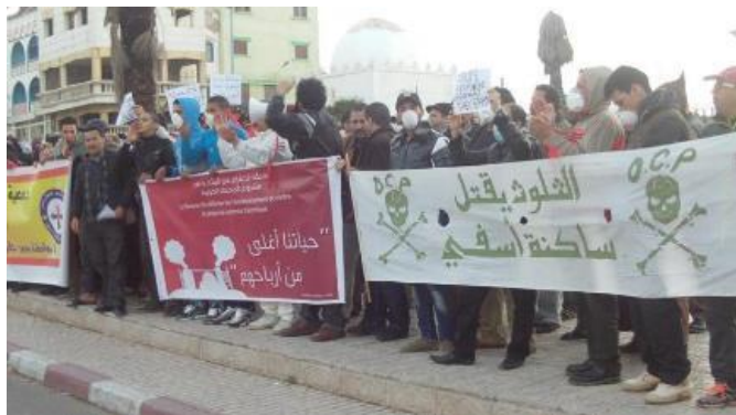
Manifestation en 2014 à Safi contre l'implantation d'une centrale thermique et contre la pollution causée par l'OCP. Source : France24 67 .

En 2014, l'Association Marocaine des Droits de l'Homme, Attac Maroc et des associations de riverains ont organisé une manifestation dans la ville de Safi pour protester contre la construction d'une centrale à charbon à côté du site de l'OCP et contre la pollution causée par l'OCP (voir photo). La manifestation a réuni environ 200 manifestants 68 .