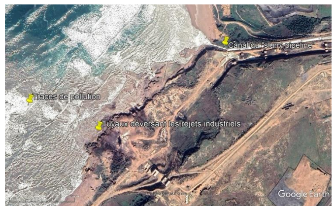
Jorf Lasfar : les pollutions sont visibles sur les photos satellite.