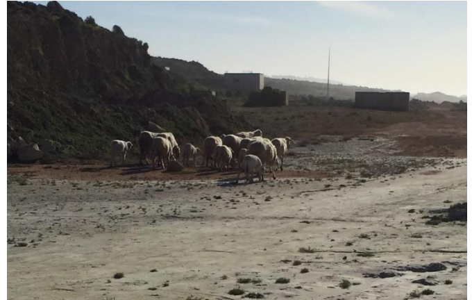
Troupeau de moutons paissant sur un sol blanchi par la pollution à côté de Jorf Lasfar (février 2019).

L'OCP parle, sur son site Internet, « d'utilisation raisonnée et optimisée des ressources en eau 95 ». En particulier, l'OCP affirme que sa consommation d'eau atteindra environ 160 millions de m 3 par an, et que « 35 % de notre consommation actuelle en eau provient du dessalement d'eau de mer et du traitement des eaux usées urbaines, avec l'ambition de porter ce chiffre à 100% dans les prochaines années 96 ». Par contre, l'OCP n'a pas répondu aux questions des auteurs sur la quantité de rejets liquides et sur la manière de dépolluer ces rejets industriels.