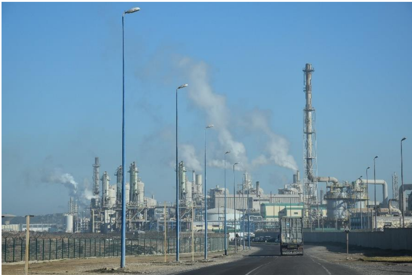
Le site de l'OCP Safi en février 2019 : des fumées toxiques et des poussières fines s'échappent en permanence des cheminées.