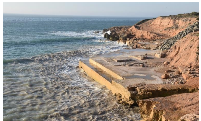
Mars 2019 : Les déversements industriels se font par une conduite sous-marine cachée sous la dalle de béton.