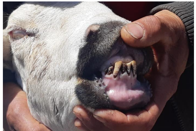
Dents brunes d'un mouton dans un village à proximité de l'OCP Safi (février 2019).

Une ONG locale, l'Association du Littoral pour le Développement, indique que de nombreux agriculteurs autour du site de l'OCP ont déposé des requêtes pour obtenir des compensations pour la pollution. Avant 2010, le tribunal se prononçait en faveur des agriculteurs et obligeait l'OCP à les dédommager pour les dommages subis (terres polluées, animaux malades, arbres desséchés). Depuis 2010, plus aucun agriculteur n'a reçu de compensation, le tribunal arrivant à la conclusion qu'il n'y avait pas de dommages. Les personnes interviewées en 2019 ont affirmé qu'elles considèrent ce revirement du tribunal comme étrange et inexplicable. En effet, les pollutions ne se sont