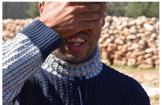
Personne présentant une fluorose dentaire dans un village proche de l'OCP Safi (février 2019).