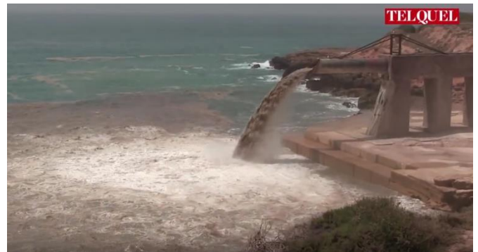
Tuyau de déversements industriels dans la mer au large du site de l'OCP Safi en 2015 5