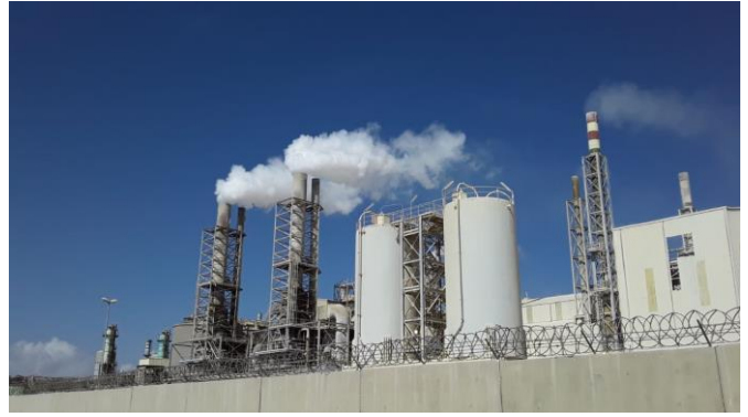
Fumées s'échappant des cheminées du site de l'OCP Safi en février 2019.

Ainsi, la production d'engrais phosphatés engendre de nombreuses pollutions et de nombreux risques pour la santé humaine et animale. Dans le cas de l'OCP, l'enquête démontre des impacts négatifs importants sur la santé des travailleurs et sur les communautés riveraines, ainsi que sur l'environnement (voir chapitres suivants).