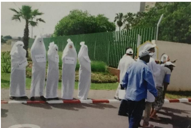
Protestation en 2015 contre des dangers pour la santé des travailleurs devant l'entrée du site de l'OCP à Safi.

L'OCP devrait : 1) installer rapidement la technologie SULFACID sur l'ensemble de ses lignes de productions ; 2) prendre des mesures complètes et efficaces visant à protéger la santé de tous ses travailleurs, comme par exemple des masques à gaz plus performants, des contrôles de santé réguliers et des investissements dans des technologies propres ; 3) faire un suivi basé sur des indicateurs de la façon dont ces impacts sont traités ; 4) communiquer sur la façon dont les impacts sont traités ; 5) mettre en place un système efficace de dédommagements aux employés qui ont contracté des maladies sur le lieu de travail ; et 6) recenser des données sur le nombre de travailleurs touchés par des maladies et/ou des accidents et sur le nombre de travailleurs décédés, et communiquer ces données aux différents syndicats.