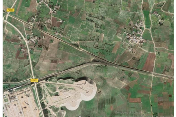
Des montagnes de phosphate sont entreposées à proximité immédiate de village, comme celui de El Bured.

Cette situation dure depuis des années. D'après le reportage de la Télévision suisse alémanique 66 de 2015, « un examen médical public des poumons, que la population de Safi pouvait faire gratuitement, a révélé un résultat dévastateur: 80% des personnes examinées avaient un emphysème ».