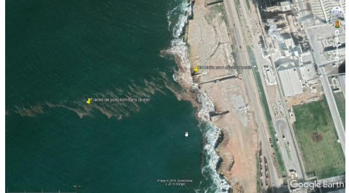
OCP Safi : conduite de déversement des eaux industrielles et traces de pollution dans la mer.

ont affirmé qu'en 2017, l'OCP a remplacé ce tuyau par une conduite sous-marine après la parution de plusieurs articles critiques dans la presse. Cela signifie qu'en 2019, les déversements sont cachés par la conduite sous-marine. Mais la pollution de la mer reste visible (voir photos).