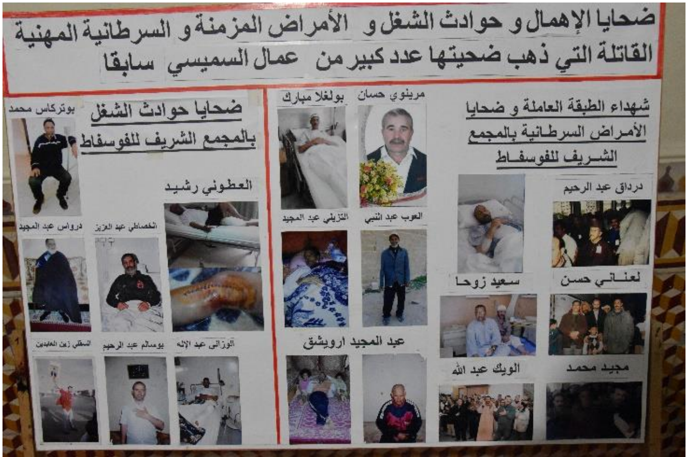
Photos d'agents OCP décédés (à droite) ou blessés dans des accidents de travail (à gauche).