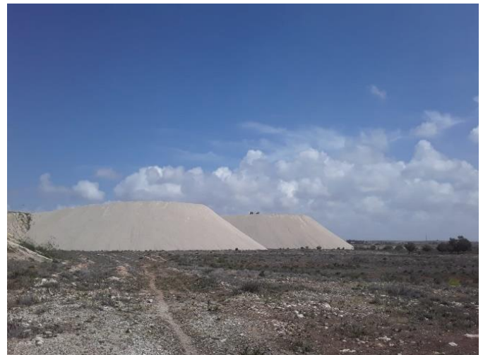
Montagnes de phosphate près du village de El Bured (février 2019).