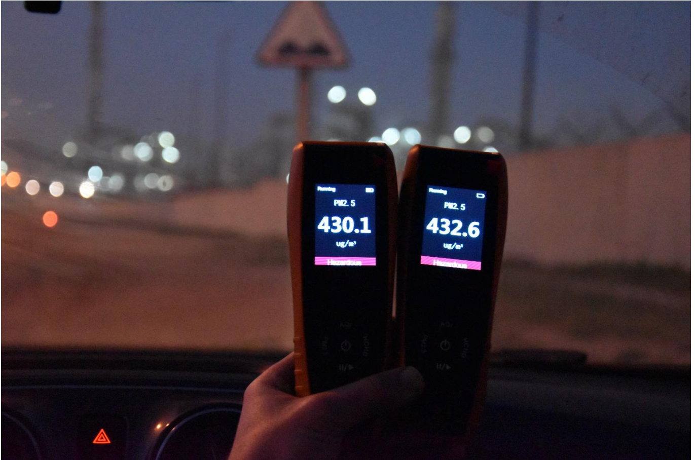
Mesure de la qualité de l'air à côté de l'OCP Safi en février 2019 : entre 430 et 432 g/m3.