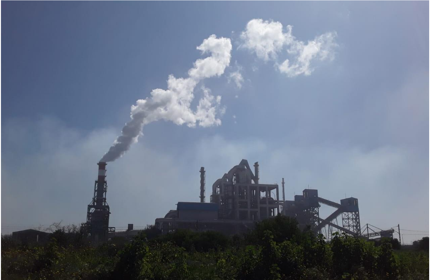
Fumée s'échappant de l'usine de l'OCP Jorf Lasfar en mars 2019.