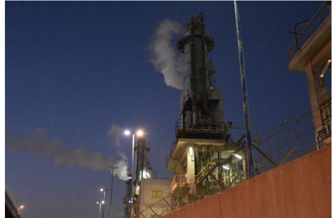
Panache de fumée au-dessus de cheminées de l'OCP Safi (février 2019).