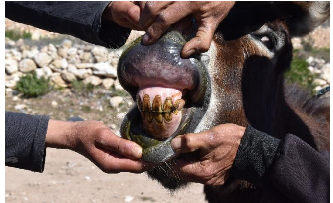
Âne souffrant de fluorose dentaire dans un village à proximité de l'OCP Safi (février 2019).

Les habitant-e-s expliquent que les arbres ont de la peine à pousser à cause de la pollution et que de nombreux arbres sèchent ou sont moins productifs (oliviers, figuiers). Ceci entraîne également un manque à gagner pour les paysans.